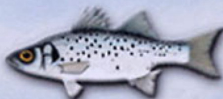
BAILA Dicentrarchus punctatus