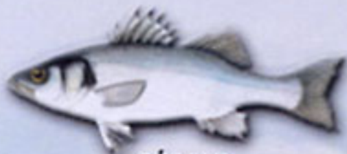
RÓBALO Dicentrarchus labrax