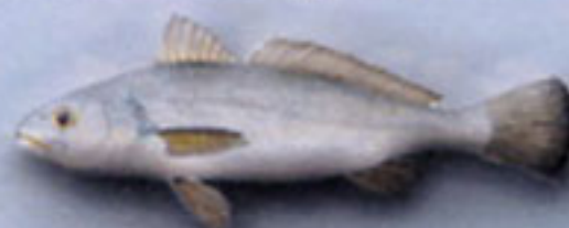
CORVINA Argyrosomus regius