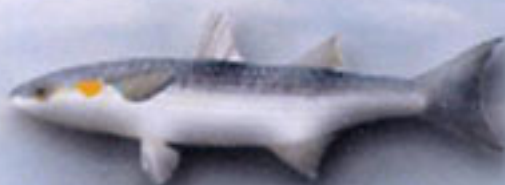
LISA Liza aurata