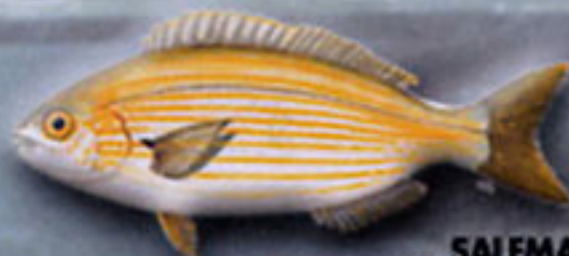
SALEMA Sarpa salpa