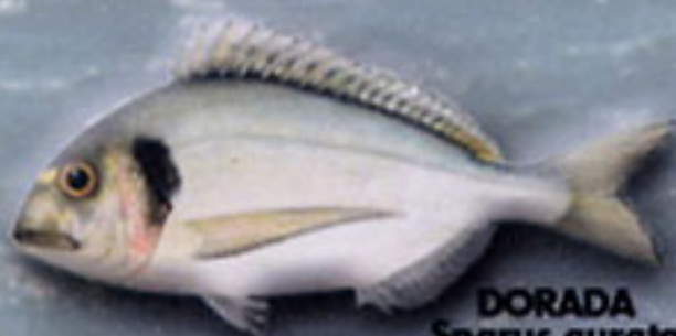
DORADA Sparus aurata