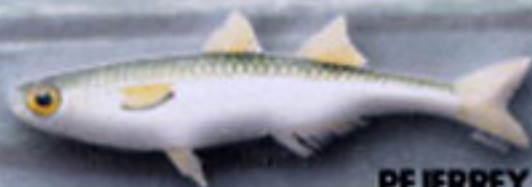
PEJERREY Atherina boyeri