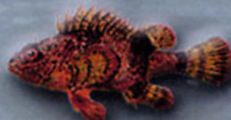
RASCACIO Scorpaena porcus