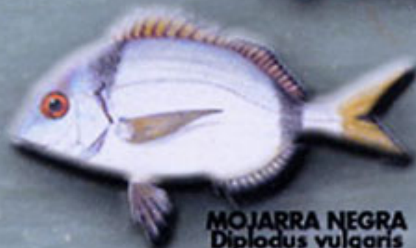
MOJARRA NEGRA Diplodus vulgaris