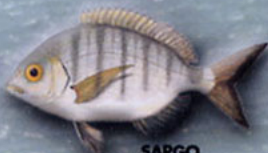
SARGO Diplodus sargus